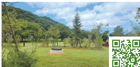
SORAIRO 国上 キャンプフィールド&RVパーク