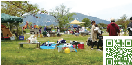
吉田ふれあい広場