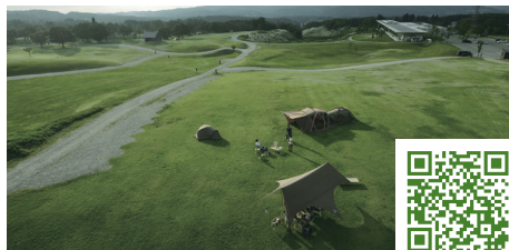
スノーピークHeadquartersキャンプフィールド