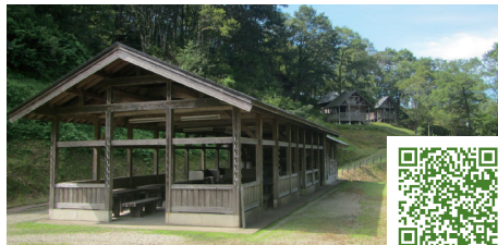
中浦ヒメサユリ森林公園