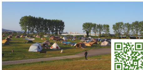
ミズベリング三条