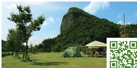
CAPTAIN STAG® 八木ヶ鼻オートキャンプ場