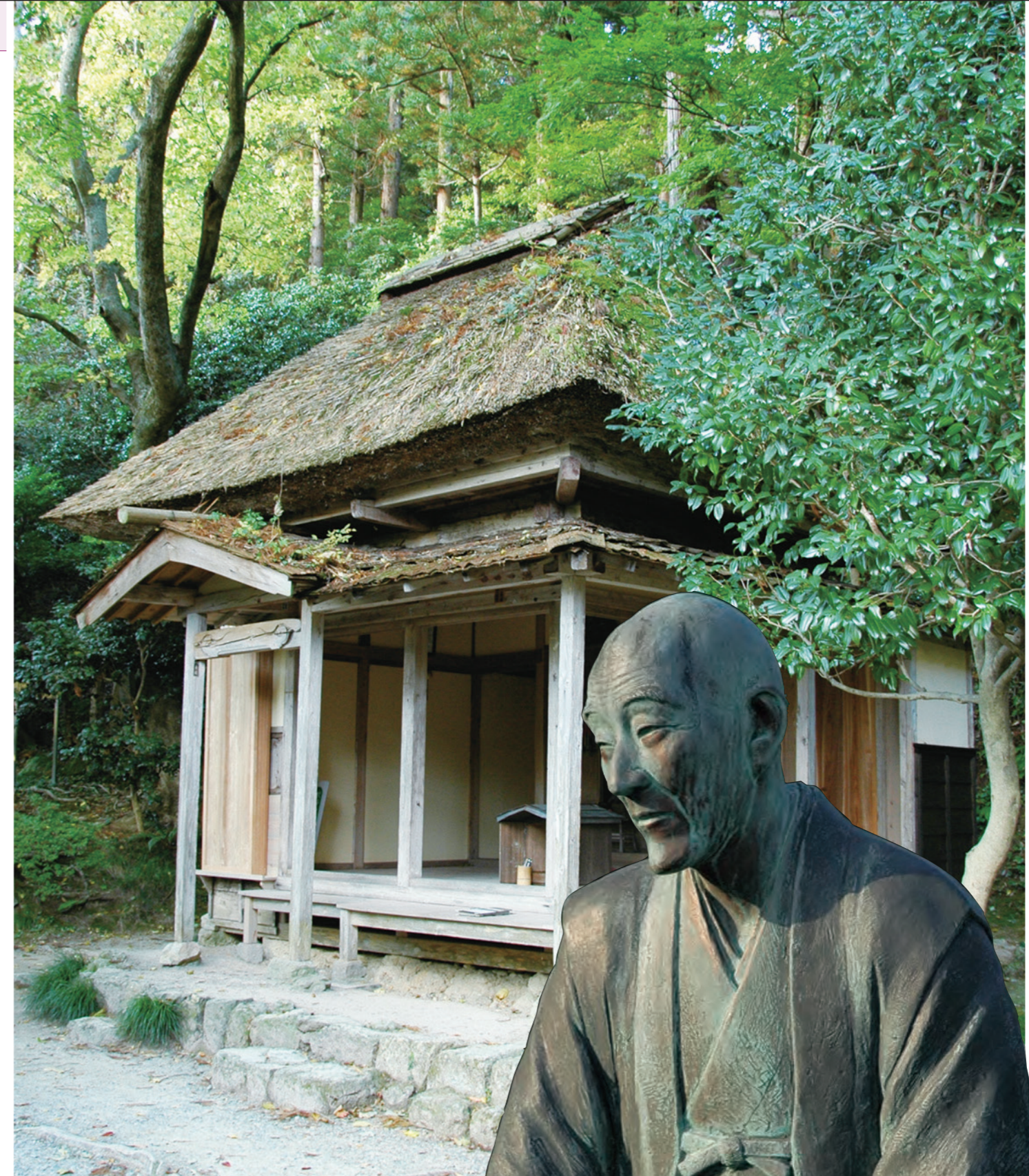
ごとうあん 五合庵 良寛が修行を終え、越後に戻って約20年を過ごした庵。庵の名前は、国上寺本堂を再建した客僧・萬元上人が1日あたり米五合を給されていたことに由来しています。

出雲崎の名主に生まれながらも、豊かな感受性と純真さから出家した良寛。諸国行脚の末、修行の地を求めたどり着いた国上山 くがみやま には、数々の逸話が残されています。ゆかりの地をめぐると、良寛の心に触れることができます。