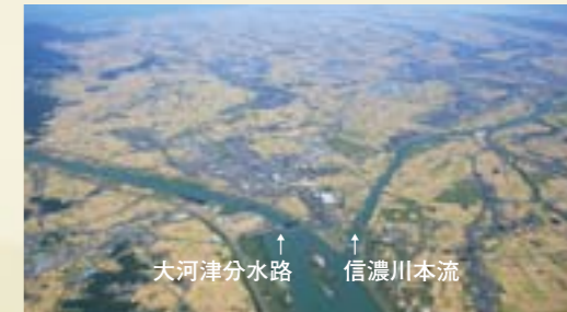
大河津分水路 ↑ 信濃川本流 ↑