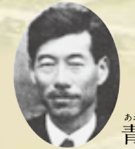
あおやま あきら 青山 士

可動堰建設の総責任者であった青山士は、部下である宮本武之輔を支え、僅か4年で可動堰を完成させた。可動堰の完成にあたっては次の言葉を石碑に刻んでいる。「万象二天意ヲ覽ル者ハ幸ナリ」「人類ノ為メ國ノ為メ」漢学の思想にも通ずるという言葉は良寛の影響を受けたとも言われている。なお、青山士はパナマ運河の建設に携わった唯一の日本人であり、東京を流れる荒川放水路工事の指揮を執った人物でもある。旺盛なるチャレンジ精神と清く正しく白き青山の生き方は技術者の有るべき姿として今なお語り継がれている。