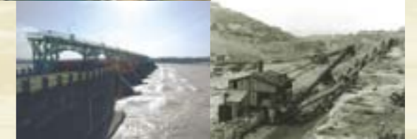
洪水を流す可動堰